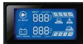
Panel de control y monitoreo LCD Nivel de carga/Nivel de Baterías Voltaje de entrada y salida/Frecuencia de salida Temperatura del equipo