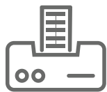
IMPRESIÓN TÉRMICA DIRECTA